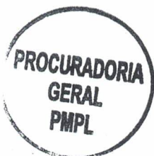
ELOÍSA HELENA CARVALHO DE FREITAS PEREIRA Prefeita do Município de Pedro Leopoldo