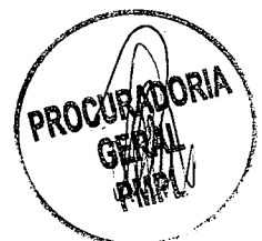
CRISTIANO ELIAS DOS REIS COSTA Prefeito do Município de Pedro Leopoldo

Prefeitura Municipal, aos 31 de Julho de 2017.