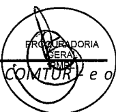
CRISTIANO ELÍAS DOS REIS COSTA PREFEITO DO MUNICÍPIO DE PEDRO LEOPOLDO

Prefeitura de Pedro Leopoldo, 19 de novembro de 2020.